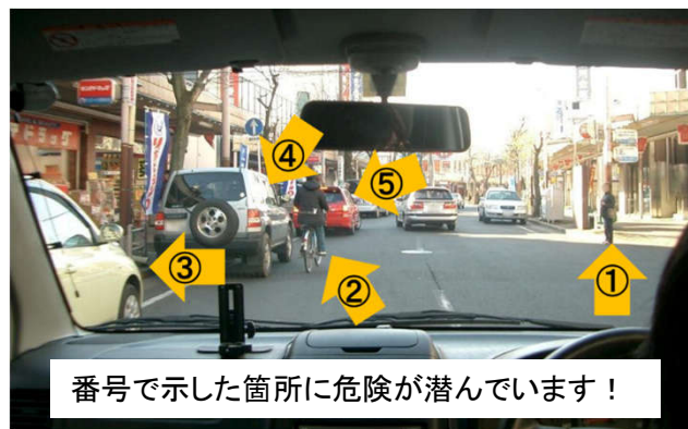
番号で示した箇所に危険が潜んでいます！

特に歩行者等が多い市街地では、危険が多く潜んでいますので、必ず危険予測運転を実践しましょう。