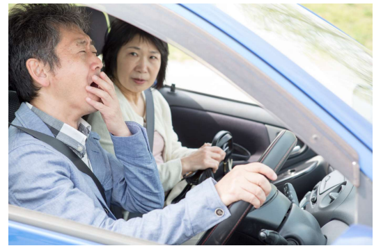
図1 睡眠時間による事故発生率