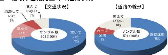
図3 居眠り運転発生時の道路状況