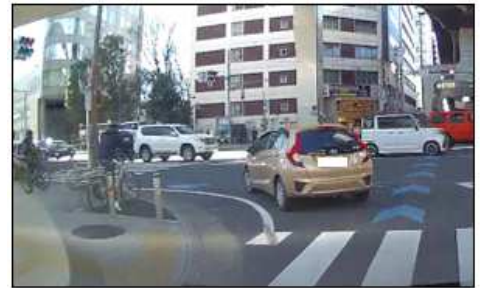
歩車分離式信号の導入された交差点

今号では、歩行者事故の現状を確認し、左折時を中心にその危険性と対策について考えましょう。