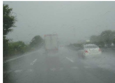
異常気象により、急変する道路環境

今回は、近年の異常気象による被害の確認を通じてそのような状況下で、被災しない運転行動を考えてみましょう。