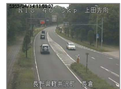
ライブカメラ画像の例

■全日本トラック協会Webサイト:「異常気象時における気象情報等の入手先(例)」 http://www.jta.or.jp/info/anzenkakuho202003/03.pdf ※道路情報、気象情報等を提供するWebサイトが見やすく整理されています。