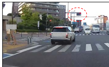
②赤信号でもそのまま通過！