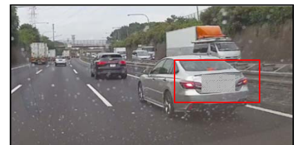
②後続車がブレーキ

このようなリスクテイキング行動の連鎖は、非常に危険であり、当初の状況より、重大事故のリスクが更に高まっていることが分かります。