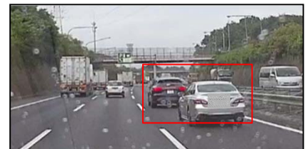
③車間距離不保持の状態での追走