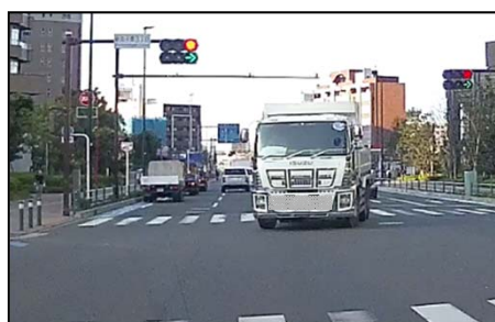
③通過後、対向車がようやく右折