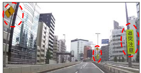
S字カーブと追突注意