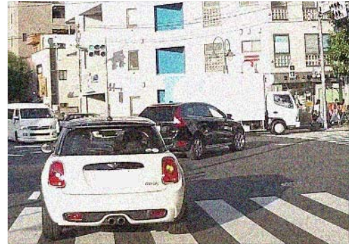
危険に満ちた右折シーン

右折は、運転の中でも、特に注意を要する難しい行動です。この右折に、多くのドライバーが、初心者のころは大変緊張したにも関わらず慣れが生じると、いつしか、その危険性を過小評価するようになってはいないでしょうか。今号は、重大事故が後を絶たない右折について、改めてその危険性や走行の基本などを取りあげましたので、是非、自身の「右折」行動をチェックする参考としてください。