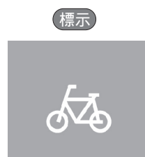
【自転車及び歩行者等専用】 【普通自転車歩道通行可】