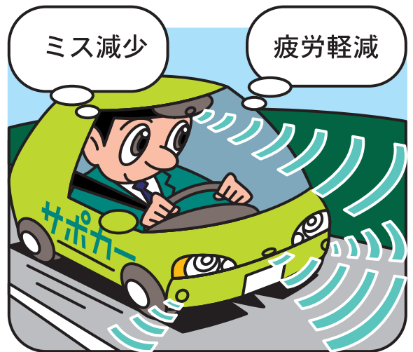
【車線逸脱警報装置の作動例】