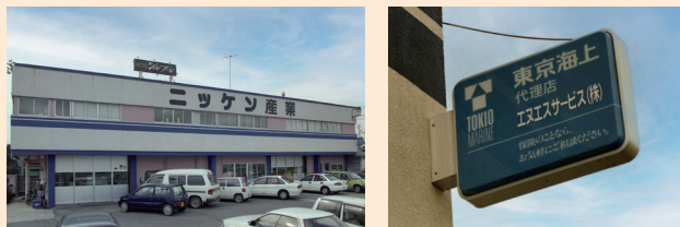
創業当時の社屋と看板 (栃木県足利市福富町)